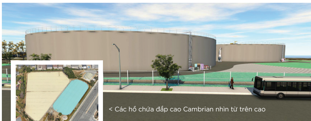
< Các hồ chứa đắp cao Cambrian nhìn từ trên cao

Trạm Cambrian của San Jose Water hiện bao gồm hai hồ chứa đắp đất lớn với sức chứa lần lượt là 12.1 triệu gallon và 3.9 triệu gallon. Hồ chứa đầu tiên được xây dựng lần đầu vào năm 1890 và hồ chứa thứ hai vào năm 1921 – cả hai đều đã hết thời hạn sử dụng. Vào năm 2024, chúng tôi đang bắt đầu một dự án xây dựng kéo dài nhiều năm để xây dựng hai bể chứa mới – cung cấp 16 triệu gallon nước sạch cho khách hàng. Để biết thêm thông tin, hãy truy cập: sjwater.com/Cambrian .